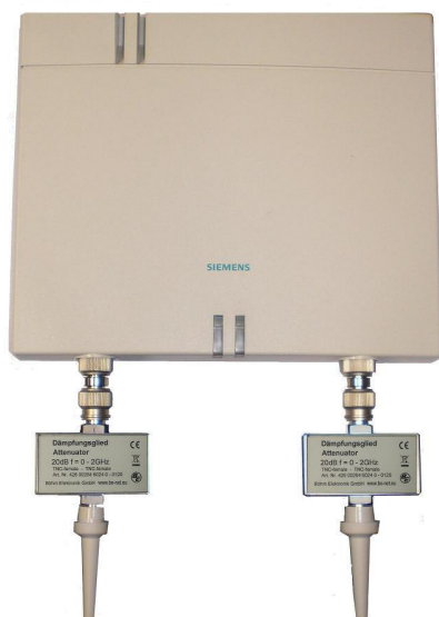
Foto oben / Photo above: Die DECT Basisstation BS4 mit 2 Dämpfungsgliedern zwischen TNC Buchse und Antenne / The DECT base station with 2 Attenuators fitted between the TNC sockets and the antennas

Das Gehäuse ist optimiert für BS 4 Basisstationen / The cabinet of the Attenuator is optimized for the BS 4 base stations